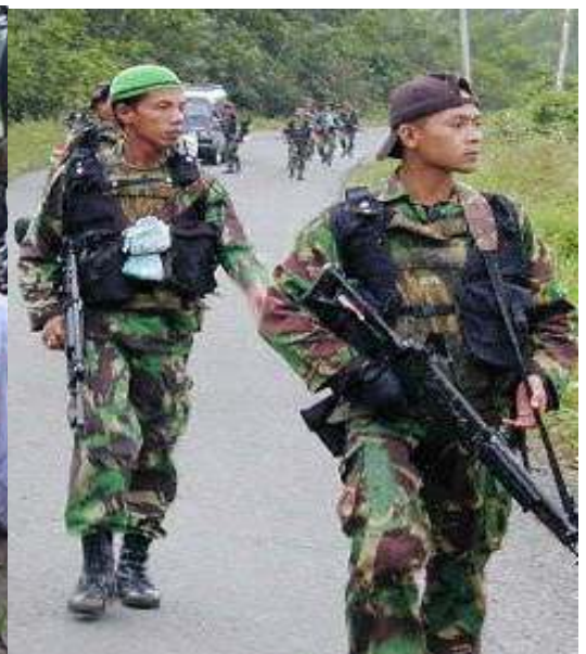
ขบวนการอาแจห์เสรี Gerakkan Aceh Merdeka ก่อตั้งและเริ่มปฏิบัติการปี 2519 โดยเต็งกูฮานัน ดิ ตีโร ประกาศเอกราช