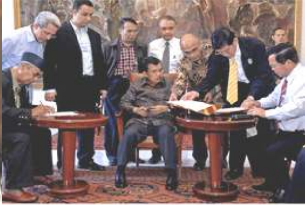
ภาพการเจรจาของ อภิชนแห่งภาค 4 ของไทยที่อัมโคตจีซ ซึ่งยังเป็นปรักษาการเจรจาของ อภิชนแห่งภาค 4 ของไทยที่อัมโคตจีซ ซึ่งยังเป็นปรักษา

กระบวนการสร้างสันติภาพในอาเจห์ (Making Peace: Ahtisaari and Aceh) สันติภาพในอาเจห์: คนกลางต้องเป็นผู้ที่มีบารมีเป็นที่ยอมรับและเชื่อถือได้ บทความนี้ได้รับมาจากคุณ บุรฮานุดดิน อุซซิง บทความนี้ได้มีการปรับปรุงบางประโยค และย่อหน้าเพื่อความสะดวกในการอ่าน โดยกองบรรณาธิการมหาวิทยาลัยเที่ยงคืน