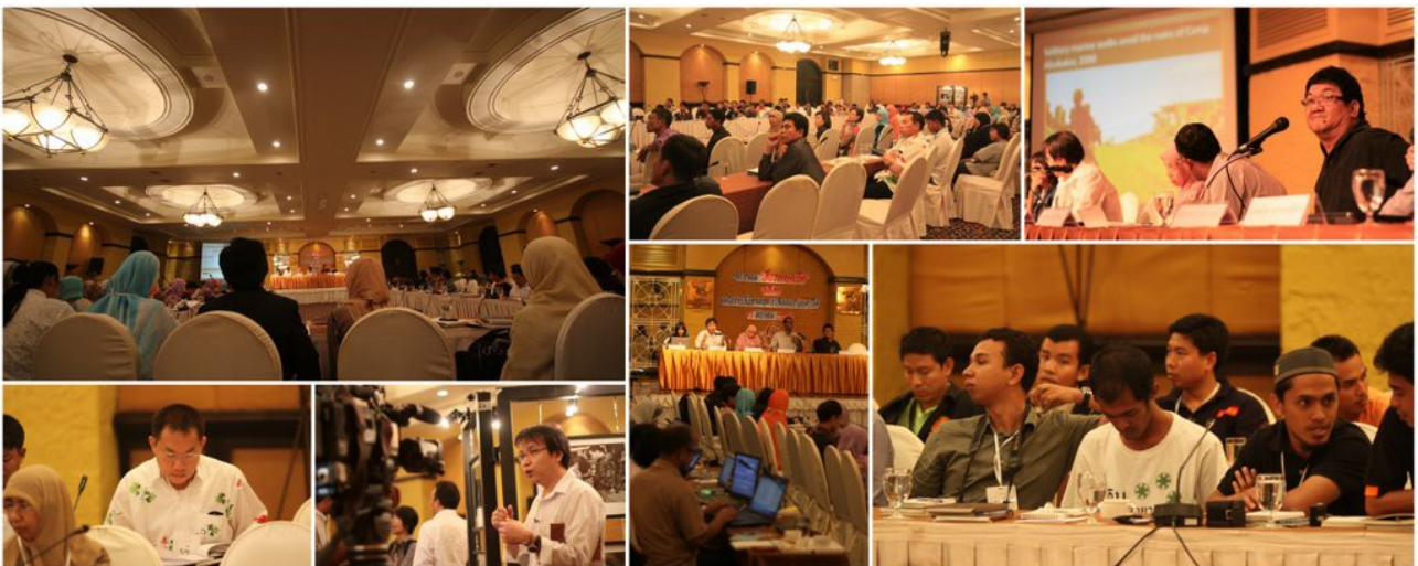
ภาพบรรยากาศงานวันสื่อทางเลือกชายแดนใต้ครั้งที่ 1

อนึ่ง ในงานวันนี้นี้ยังได้เชิญชวนเครือข่ายต่างๆ นำเสนอเนื้อหาของแต่ละองค์กรมานำเสนอ เพื่อสร้าง "พื้นที่การแลกเปลี่ยนเรียนรู้ระหว่างกัน" ด้วย เช่น การจัดนิทรรศการของเครือข่ายช่างภาพชายแดนใต้ ศูนย์ประสานงานวิชาการให้ความช่วยเหลือผู้ได้รับผลกระทบจากเหตุความไม่สงบจังหวัดชายแดนใต้ (ศวชต.) หน่วยรณรงค์สันติภาพ (NaRa Peace) ของฉก.33 นราธิวาส รวมทั้งเป็นส่วนหนึ่งในการขับเคลื่อนร่วมกับเครือข่ายสตรีภาคประชาสังคมเพื่อสันติภาพชายแดนใต้ แดงข่าวผลการศึกษา "เพื่อผ่านพ้นความทุกข์ยากของผู้หญิงภายใต้สถานการณ์ความรุนแรง จังหะก้าวสร้างกระบวนการสันติภาพจังหวัดชายแดนใต้" เนื่องในโอกาสครบรอบ 100 ปี วันสตรีสากลด้วย