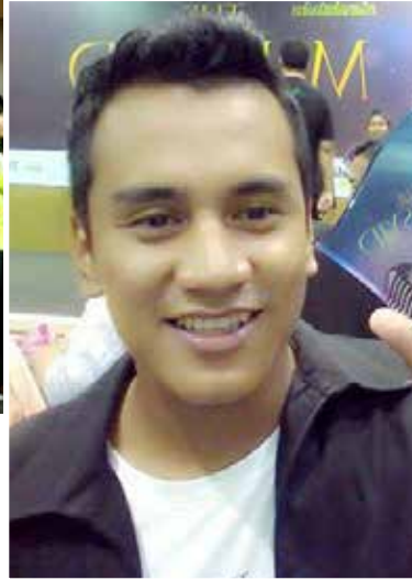
بصرى وانيت، جوارا دارى راجابت جالا

کالي اين برکات بهوا، أسباب اييو سنديري جوک يڭ مندوروغکن ساي انتوق برمينت دغن سوارا اناشيد، سهيڭک دافت منرجون کميدان اين.