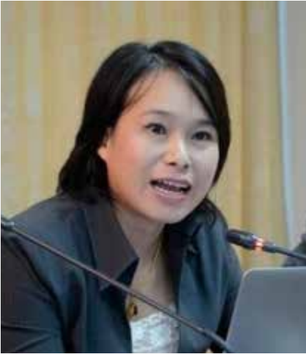
مدین. فروفیسور. دوکتور. والاقکامون چغکامون

دافت منجادی سومبر بریتا یغ بولیه دفرچیایي باکي فمبریتا دري لوار، بایک دري دالم ماهوفون دري لوار نکارا.