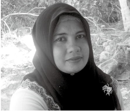
روسني وي بسر

سربوق تيه دان کوفي، إخلاص ممفوپاي راموان يڭ ترسنديري يڭ فستي دامبيل دري فميليک فرينشاي سهاج، بکيتو جوک دڭن ساروغ قرتس.