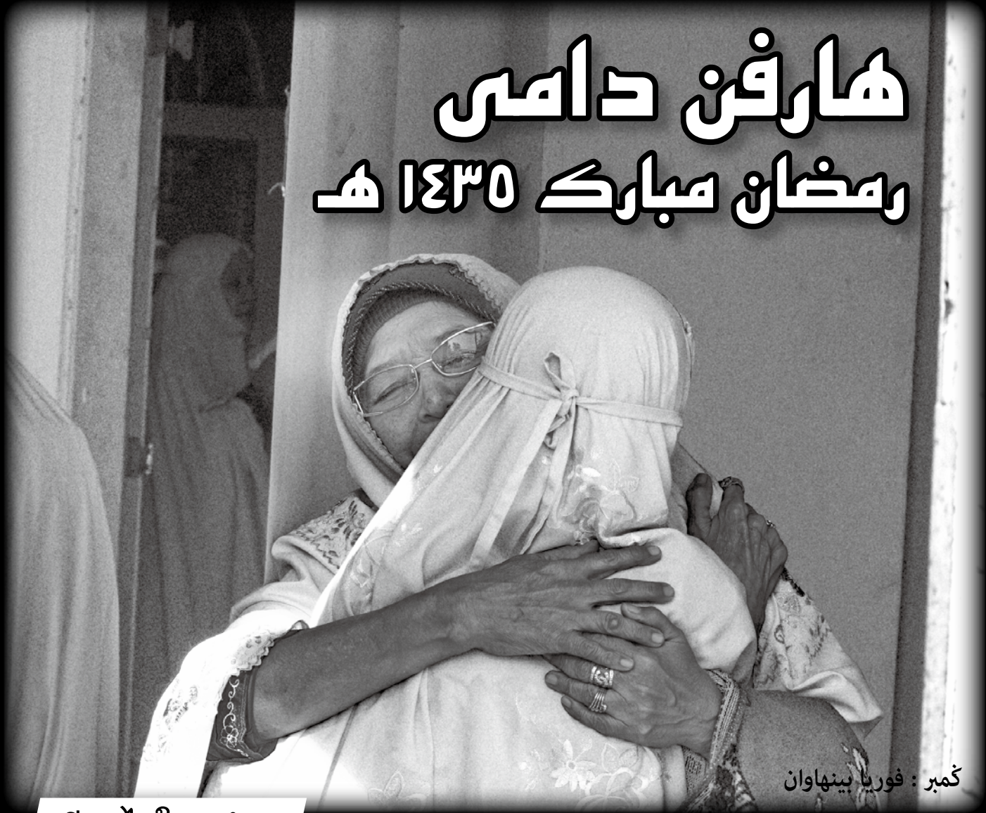
کمبر : فورى بينهاوان