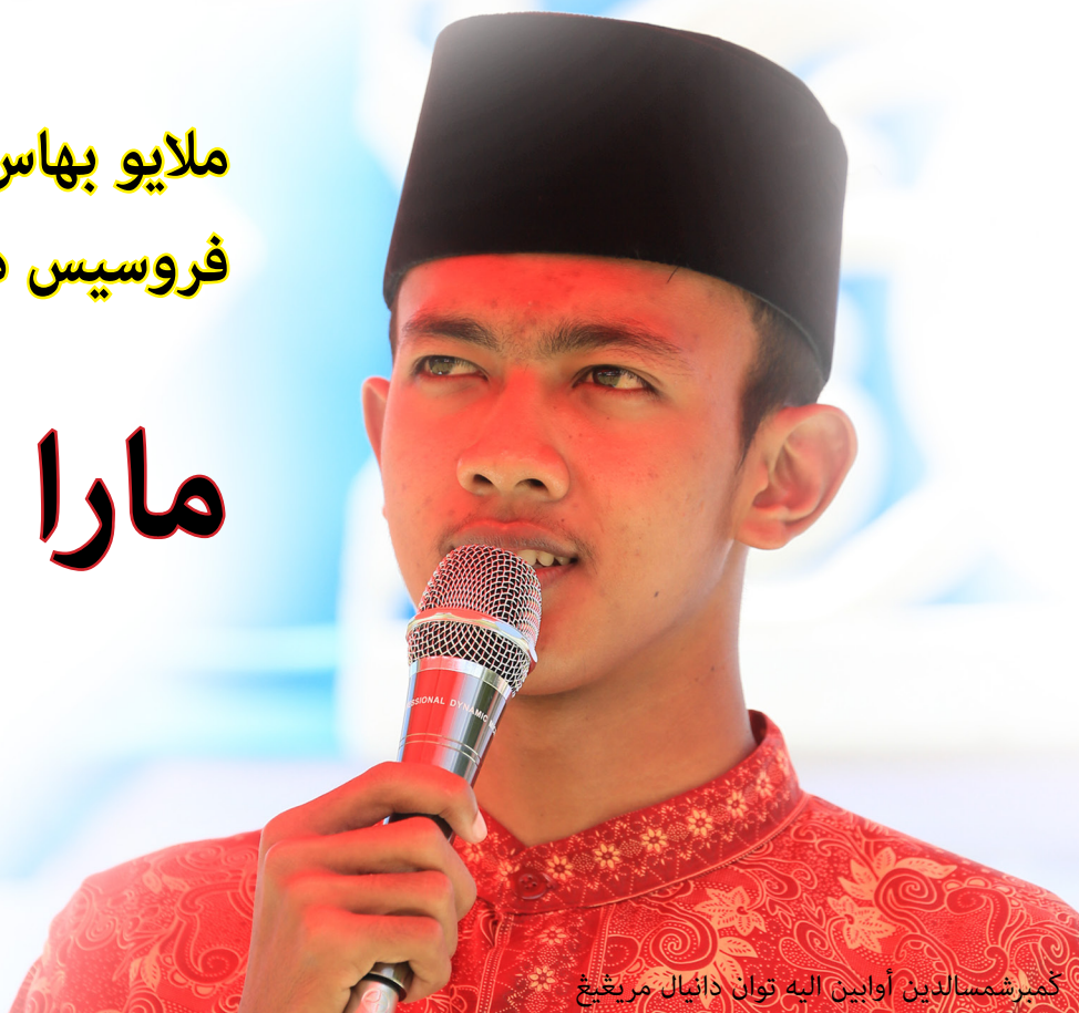
كمبرشمسالدين اوابين اليه توان دانجال مريغينغ

“ اواپين خاخوتين ” رونغخمبسنترพจน์นาาชาติ ตัวแทนไทยที่ใช้มลายูเป็นภาษาแม่ หน้า 3