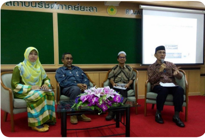
فرتموان "سيناران" دغن جاريغن بهاس ملايو كالي فرتام

تجوانن اياله اونتوق مڭهوبوغي دان ممقرلواسن كلومقق فمباچ "سيناران" دان رساله برينا "فتاني ميڭكون" دان منچيقتاكن كرجسام دام فمبينان ميديا بهاس ملايو فدا ماس دقن، ساساران فنتيغ اياله لمباك فنديديقن دان اورگانيساسي يڭبرقرانن دام بهاس ملايو، چاران اياله دغن مڭاداكن سمينار مينيمالڭ دوا بولن سكالاي.