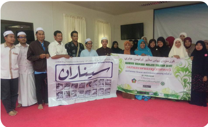
فرتموان "سيناران" دغن جاريغن بهاس ملايو كالي كدوا