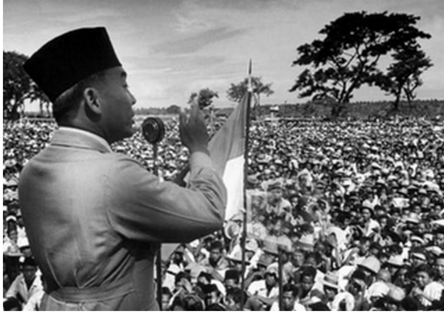
17 August 1945