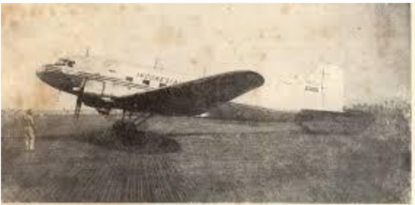
(Gambar 55) Pesawat penangkut RI-001 "Sriwijaya", sebuah pesawat Douglas C-47B, yang dibudhihkan oleh rakyat Aceh kepada pemerintah RI, dan yang pada waktu sks) militer II dengan pimpinan komodor muda adara Wiyoko menjadi modal untuk mendirikan "Indonesia Airways".