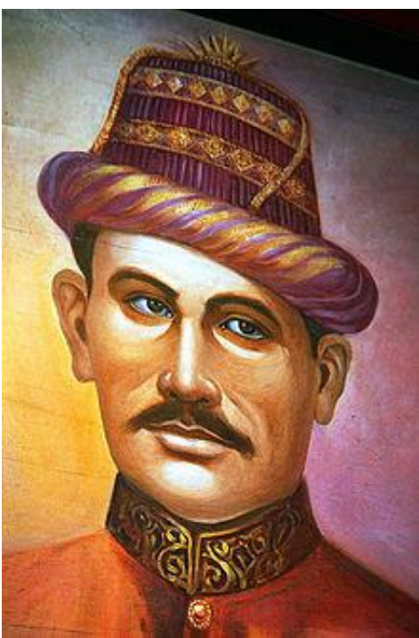
Sultan Iskandar Muda 1607 - 1636