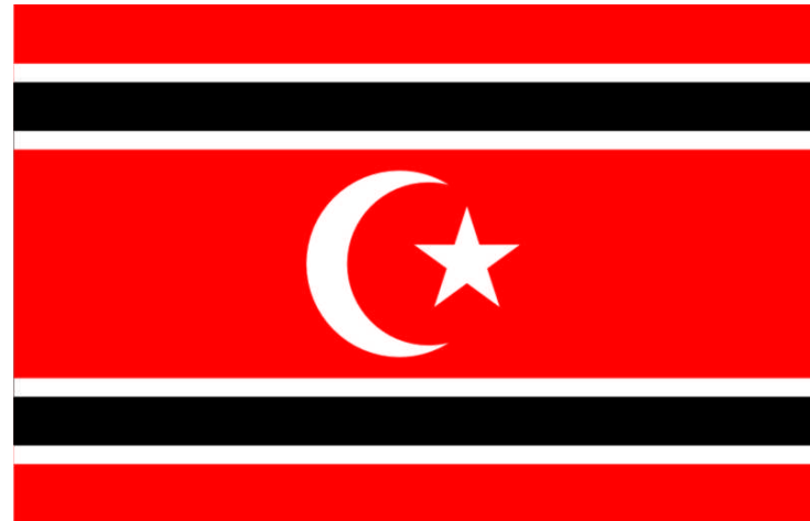
Gerakan Aceh Merdeka (GAM)